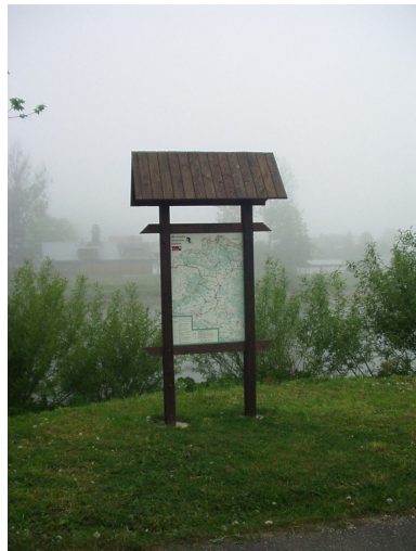
Orientačná mapa pre cykloturistov