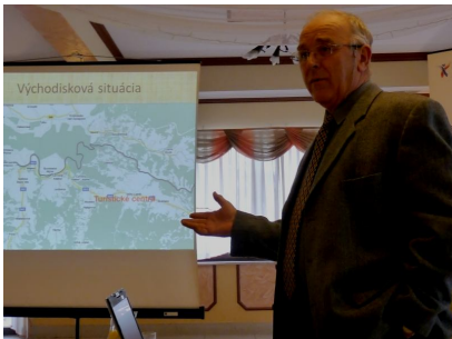
Prezentácia nášho projektu v Čorštyne

príprava“ podporená z prostriedkov Európskeho fondu regionálneho rozvoja v rámci Programu cezhraničnej spolupráce Poľsko– Slovenská republika 2007-2013, mikroprojekty evidovaný pod číslom PL-SK/PO/IPP/I/120 vo výške 43 792,00 €.