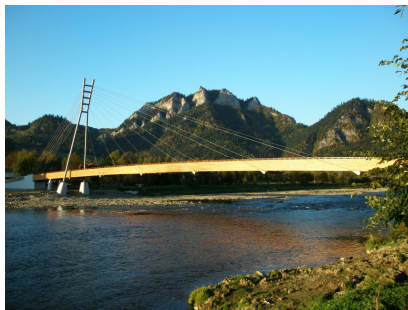
Lávka cez riekou v Červenom Kláštore

turistického ruchu sú ponad riekou spojené lávkou pre peších a cykloturistov ponad riekou Dunajec.