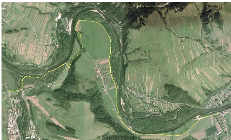
Priebeh navrhovanej cykloturistickej trasy

Cykloturistická trasa sa napája na križovatke ciest 542 a 543 v Spišskej Starej Vsi, na novovybudovaný chodník z Niedžici cez Lysú nad