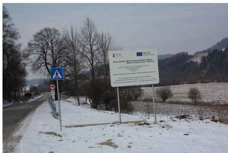
Začiatok cyklotrasy - Spišská Stará Ves

nebolo možné nájsť také vhodné technické riešenie, ktoré by nespôsobovalo výrazné prekročenie doporučených spádových pomerov.