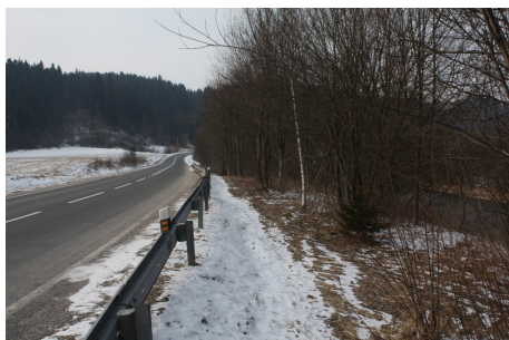
Stiesnené pomery pri Dunajci

Červenou skalou. Cykloturistický chodník obchádza obec Majere po uvedenej aluviálnej terase Dunajca až po prístavisko plti pod Majerami, odkiaľ pokračuje súběžne s verejnou cestou až do Červeného Kláštora. V úseku od prístaviska plti po obec Červený Kláštor bolo nutné vyriešiť trasovanie cykloturistického chodníka v stiesnených pomeroch medzi