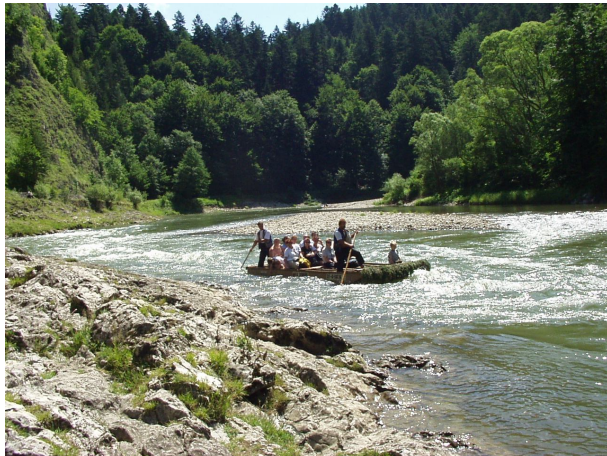
Plte na Dunajci

Celé územie, ktorým cykloturistický chodník prechádza je súčasťou ochranného pásma Pieninského národného parku.