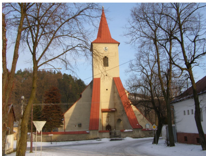
Kostol v Spišskej Starej Vsi