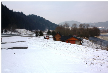
Prístavisko plti pod obcou Majere

Dedinka v doline Dunajca medzi mestom Spišská Stará Ves a obcou