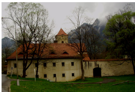
NKP Červený Kláštor

boli postavené za pôsobenia priora Štefana II. v 15. storočí.