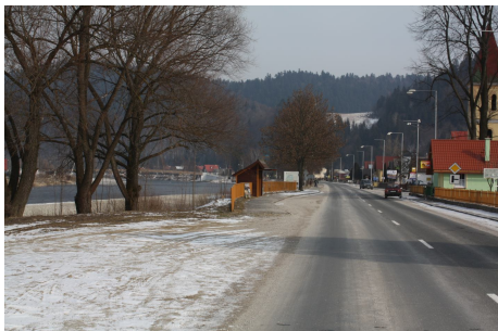
Ukončenie cyklotrasy v Čevenom Kláštore

Okrem uvedených oddychových zariadení predpokladáme, že pozdĺž